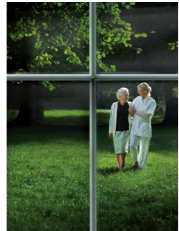
Zufriedenes Pflegepersonal ist der Garant für glückliche Betreute.

„ECOS Mobile Office“ hilft so der IT, ihrer obersten Prämisse – der Kundenzufriedenheit – voll gerecht zu werden. Und trägt ihren Teil dazu bei, im Sinne des Mottos der Diakonie Michaelshoven „mit Menschen Perspektiven zu schaffen.“