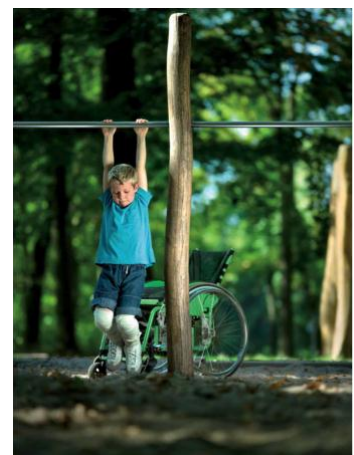
Weniger Zeit am Schreibtisch – mehr Zeit für gezielte Förderung.